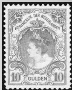
80 - postfris 10 gulden oranje 1905, Koningin Wilhelmina, cert. Dr. Louis BPP 1998, verkocht voor € 1.293