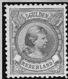
48 - postfris 5 gulden bronsgroen en roodbruin Prinses Wilhelmina 1896, lijntanding 11, cert. Vleeming 2010, verkocht voor € 1.201