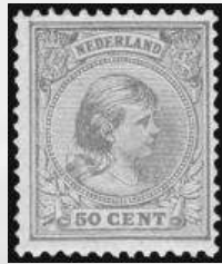
43b - postfris 50 cent geelbruin Prinses Wilhelmina 1891, met cert. Moeijes 1982, verkocht voor € 1.140