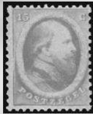
6A - postfris 15 cent oranje 1864 Koning Willem III, attest Vleeming 2013, verkocht voor € 3.199

DALLAS | NEW YORK | BEVERLY HILLS | SAN FRANCISCO | CHICAGO | PARIS | GENEVA | IJSELSTEIN | HONG KONG