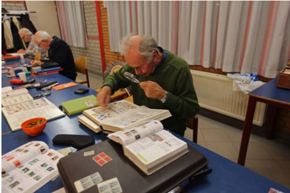
Kleine impressie van de clubavond van 7 december j.l.