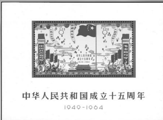
Blok 10 - postfris blok 15 jaar Volksrepubliek 1964, miniem zwart puntje in gom, verkocht voor € 1.724