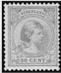
43b - postfrisse 50 cent geelbruin Prinses Wilhelmina 1891, met cert. Moeijes 1982, verkocht voor € 1.140