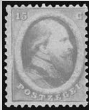
6A - postfrisse 15 cent oranje 1864 Koning Willem III, attest Vleeming 2013, verkocht voor € 3.199

DALLAS | NEW YORK | BEVERLY HILLS | SAN FRANCISCO | CHICAGO | PARIS | GENEVA | IJSELSTEIN | HONG KONG