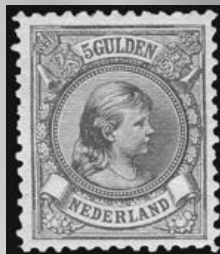
48 - postfrisse 5 gulden bronsgroen en roodbruin Prinses Wilhelmina 1896, lijntanding 11, cert. Vleeming 2010, verkocht voor € 1.201