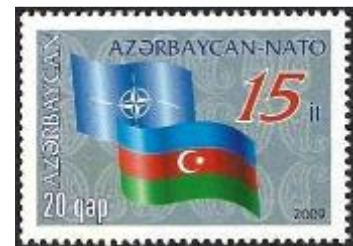
Afb. 7: 15 jaar "Partnerschap NAVO"

Tenslotte wil ik nog een postzegel uit een velletje laten zien dat is uitgegeven op 4 mei 2009 ter ere van de viering van het 15-jarig lidmaatschap van het partnerschap met de NAVO (afb. 7).