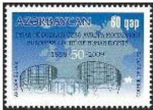
Afb 1: 50 jaar Europees Hof Rechten van de Mens

Voordat ik naar Azerbeidzjan vertrok had ik natuurlijk al geïnventariseerd welke zegels, boekjes en velletjes ik graag zou willen hebben. M.b.t. de Europazegels was ik daar al snel in geslaagd. Maar dan.....juist de afwijkende zaken die je graag wilt hebben moet je maar eens kenbaar zien te maken aan iemand die geen Engels spreekt en je toch graag wil helpen. Met behulp van een catalogus en een standaard met voorbeelden kwam ik dan toch al een heel eind. Echter, gezien de tijdperikelen rond het vertrekt met het vliegtuig zoals ik eerder al vertelde, stond ik daar verre op mijn gemak, dus kap je op enig moment de conversatie maar af en rekest af om pijlsnel naar het vliegveld te kunnen.