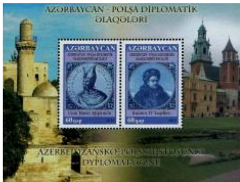
Afb.4:diplomatieke betrekking Polen

Dit houdt in, dat Azerbeidzjan maximaal 12 afgevaardigden mag aanwijzen, hetgeen verdeeld is over 6 vaste vertegenwoordigers en 6 waarnemers. De eerste bijeenkomst, bijgewoond door afgevaardigden uit Azerbeidzjan was van 24 – 27 april 2001.