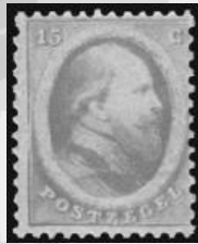
6A - postfris 15 cent oranje 1864 Koning Willem III, attest Vleeming 2013, verkocht voor € 3.199

DALLAS | NEW YORK | BEVERLY HILLS | SAN FRANCISCO | CHICAGO | PARIS | GENEVA | IJSELSTEIN | HONG KONG