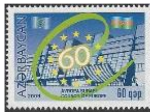
Afb.2: 60 jaar Raad van Europa