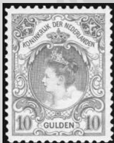
80 - postfrisse 10 gulden oranje 1905, Koningin Wilhelmina, cert. Dr. Louis BPP 1998, verkocht voor € 1.293