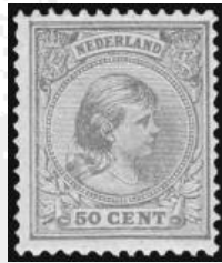
43b - postfrisse 50 cent geelbruin Prinses Wilhelmina 1891, met cert. Moeijes 1982, verkocht voor € 1.140