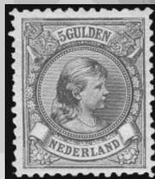
48 - postfrisse 5 gulden bronsgroen en roodbruin Prinses Wilhelmina 1896, lijntanding 11, cert. Vleeming 2010, verkocht voor € 1.201