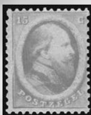
6A - postfrisse 15 cent oranje 1864 Koning Willem III, attest Vleeming 2013, verkocht voor € 3.199

DALLAS | NEW YORK | BEVERLY HILLS | SAN FRANCISCO | CHICAGO | PARIS | GENEVA | IJSELSTEIN | HONG KONG