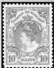
80 - postfrisse 10 gulden oranje 1905, Koningin Wilhelmina, cert. Dr. Louis BPP 1998, verkocht voor € 1.293