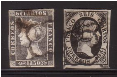
Fig. 1 Spaanse postzegels met jaartal als inschrift

Een voorbeeld vormen de eerste emissies van Spanje in de periode 1850-1854. Deze hadden een jaartal als inschrift (fig. 1). In de jaren 1850 - 1853 was het ook zo dat de geldigheid liep tot de laatste dag van het betreffende jaar. Vanaf 1 januari dienden de postzegels van het nieuwe jaar gebruikt te worden. Deze verschenen pas op deze zelfde eerste januari. De postzegels met inschrift 1854 bleven voor het eerst wat langer geldig en wel tot 1 april 1855.