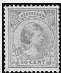
43b - postfrisse 50 cent geelbruin Prinses Wilhelmina 1891, met cert. Moeijes 1982, verkocht voor € 1.140