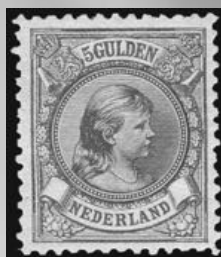
48 - postfrisse 5 gulden bronsgroen en roodbruin Prinses Wilhelmina 1896, lijntanding 11, cert. Vleeming 2010, verkocht voor € 1.201