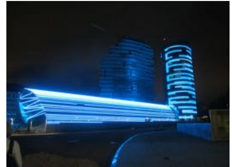
Hotel bij avond

Het gaat iets te ver om hier nu al meer over Azerbeidzjan zelf te vertellen. Wel leuk om te weten is, dat het land doorsneden wordt door de grens tussen Europa en Azië. Als je dan arriveert in Baku valt al direct op dat dit een uiterst moderne stad is met een prachtig historisch en goed bewaarde oude binnenstad.