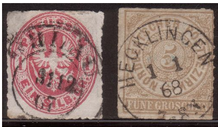
Fig. 2 Laatste dag gebruik Pruisen en eerste dag Noordduitse Postvereniging

Een belangwekkender voorbeeld is het opgaan van de postdiensten van de meeste oud-Duitse staten in de Noordduitse Postvereniging. Dit gebeurde op 1 januari 1868. Op 31 december liep de geldigheid af van alle overgaande staten. Vanaf toen hadden alleen Baden, Württemberg en Bayern nog eigen postzegels. Door de overgang liep het aantal Duitse postdiensten in de periode 1 oktober 1867 - 1 januari 1868 terug van 15 naar 4. Figuur 2 toont een bijzonder voorbeeld van deze overgang: een postzegel van Pruisen gebruikt op de laatste geldigheidsdag 31 december 1867 en een postzegel van de Noordduitse postvereniging gestempeld op de eerste dag van geldigheid, 1 januari 1868. Een dag dus van grote verandering.