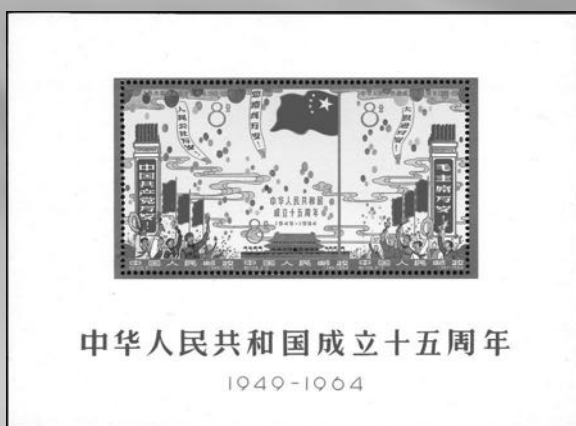
Blok 10 - postfris blok 15 jaar Volksrepubliek 1964, miniem zwart puntje in gom, verkocht voor € 1.724