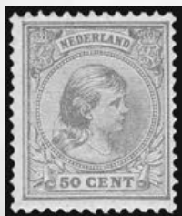
43b - postfrisse 50 cent geelbruin Prinses Wilhelmina 1891, met cert. Moeijes 1982, verkocht voor € 1.140