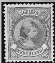
48 - postfrisse 5 gulden bronsgroen en roodbruin Prinses Wilhelmina 1896, lijntanding 11, cert. Vleeming 2010, verkocht voor € 1.201