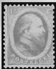
6A - postfrisse 15 cent oranje 1864 Koning Willem III, attest Vleeming 2013, verkocht voor € 3.199

DALLAS | NEW YORK | BEVERLY HILLS | SAN FRANCISCO | CHICAGO | PARIS | GENEVA | IJSELSTEIN | HONG KONG