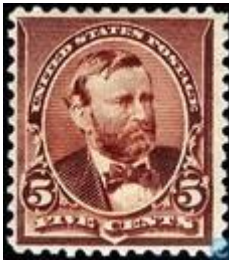
President Ulyssus S. Grant

Toen het beeld in 1884 voltooid was werd het in 214 kisten vanuit Frankrijk naar de Verenigde Staten gestuurd.