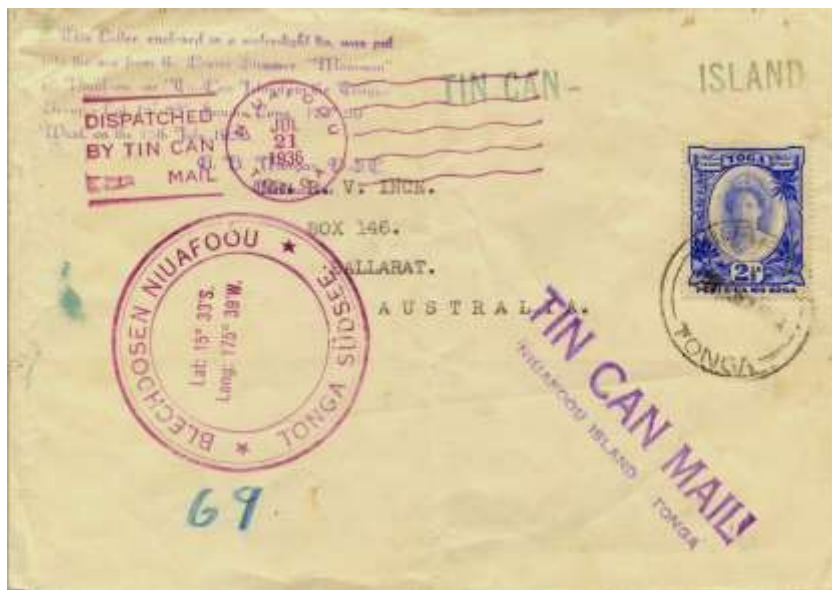
Deze brief werd in 1936 gestuurd vanaf Tonga naar Australië. Linksboven is de tekst aangebracht: "This letter enclosed in a water-tight tin was put into the sea from the Cruise Steamer Monowai.....etc"