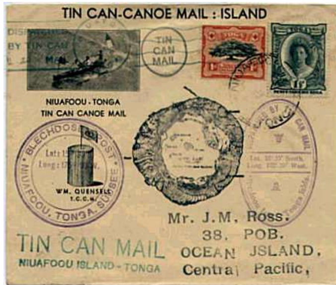
Poststuk met uiteenlopende stempels, waaronder een afbeelding van het eiland (midden)

Een volgende fase in het Tin Can Mail-verhaal brak aan toen Walter George Quensell in de twintiger jaren op het eiland arriveerde. Hij realiseerde zich al snel dat er filatelistische mogelijkheden zaten in deze wijze van postvervoer. Met een eenvoudige stempeldoos maakte hij een rubberen stempel met de tekst 'TIN CAN MAIL' en plaatste dit op alle uitgaande brieven. Daarna kwamen er allerlei stempels bij in diverse talen. Zelfs de Nederlandse taal werd gebruikt: "Blikken Bus Post".