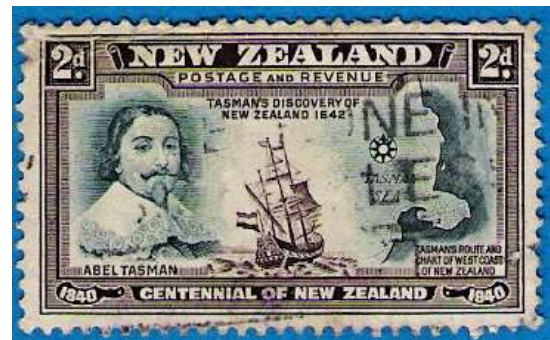
Abel Tasman herdacht door NieuwZeeland

De Nederlandse ontdekkingsreizigers Willem Cornelisz Schouten en Jacob le Maire waren in 1616 de eerste Westerlingen die aanlegden op Niuatoputapu, een van de noordelijke eilanden, gevolgd door Abel Tasman die Tongatapu en Ha'apai aandeed in 1643