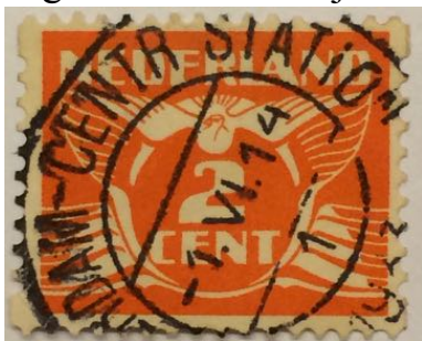
Stempel van statio Rotterdam Centrum station.

Ron van Beest vertelde aan de hand van enkele voorbeelden op welke wijze de postzegels werden ontwaard door verschillende stempels. Franco stempels, nummer stempels, klein rond- en groot rond stempels, al dan niet met datum- en tijdsaanduiding. Had men een tijdsblok van meerdere uren dan kon dit weer aantonen dat het een bij kantoor was.