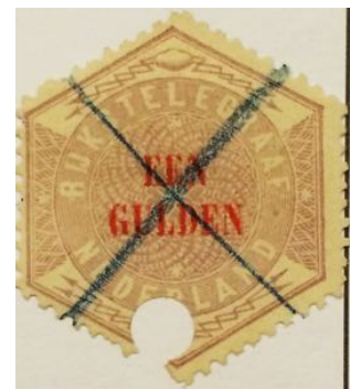
Pen- en gat-vernietiging

Ook waren er traject stempels. Zo waren er ook postzegels met een groot gat erin, in combinatie met een penne streek. Dit betref de telegram zegels.