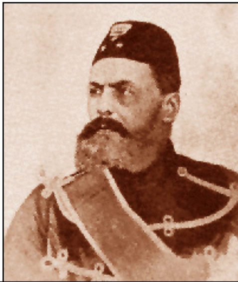
Marie de 1 e , Koning van Sedang